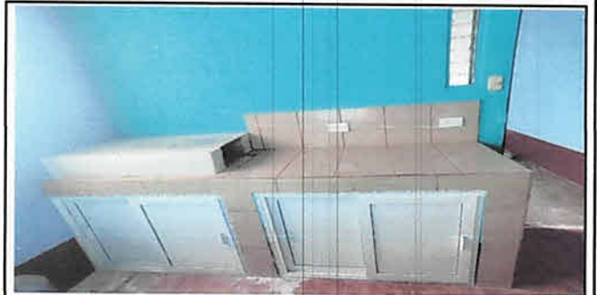
Fabricación de Mesón, Sustitución de Piso, Estufa Rural.

Observación: Si es necesario se pueden agregar hojas adicionales y actualizar el número de hojas.