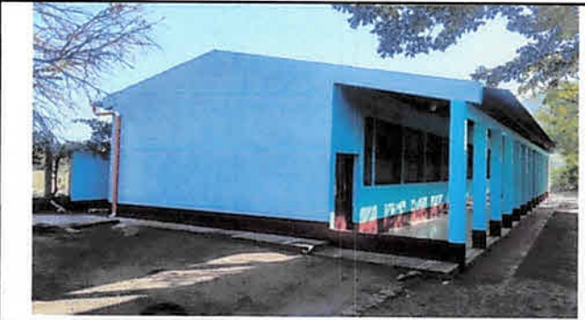
Pintura en muros interiores y exteriores.