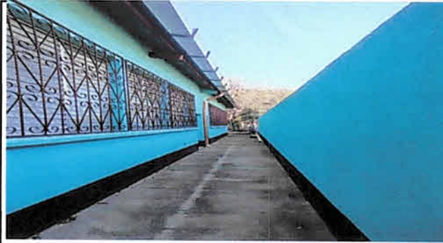
Instalación de Balcones, sustitución de Canal para agua pluvial.