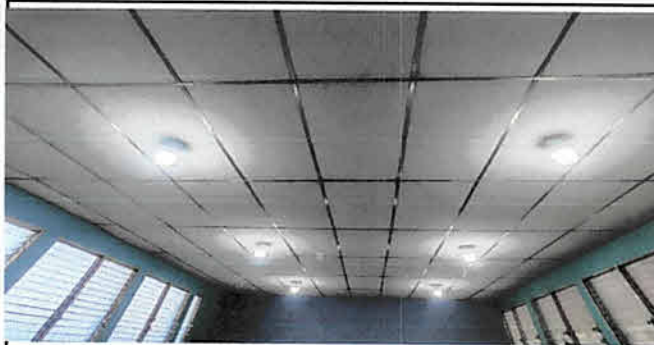
Reparación de sistema eléctrico.