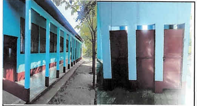
Mantenimiento de Puertas y Balcones.